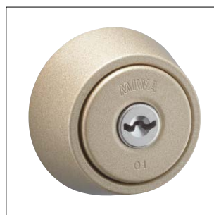
シャンパンゴールド色塗装仕上 記号：CG