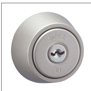
ステンカラー色塗装仕上 記号：SF