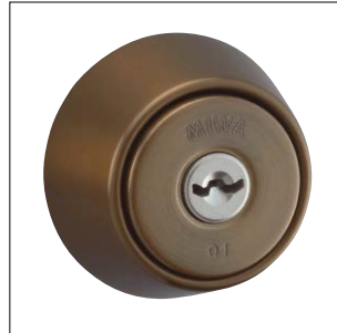
セラミックブロンズ仕上 記号：CB