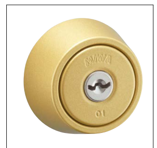
ゴールド色塗装仕上 記号：GL