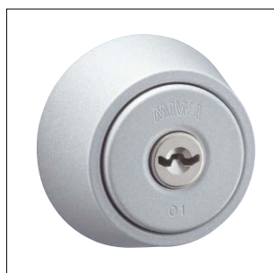
ライトシルバー色塗装仕上 記号：RV