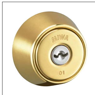
鏡面バフ仕上 記号：YB