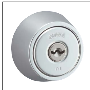
鏡面シルバー仕上 記号：S1