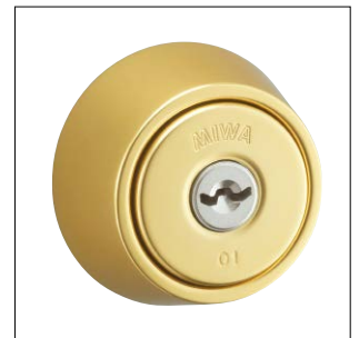
鏡面ゴールド仕上 記号：G1