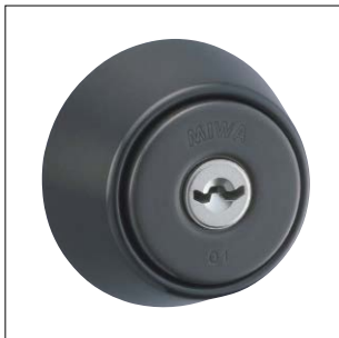
セラミックダークグレイ仕上 記号：CD