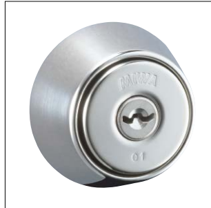
鏡面バフ仕上 記号：SB