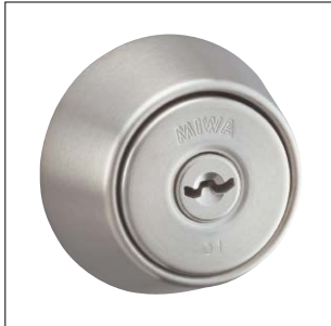
ヘヤーライン仕上 記号：ST