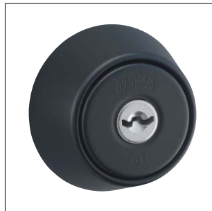
艶消し黒色塗装仕上 記号：BK