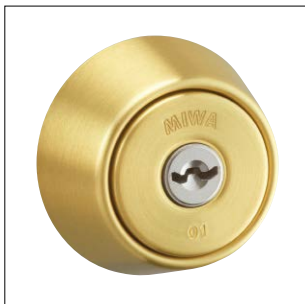
ヘヤーライン仕上 記号：BS